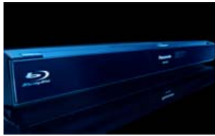
Panasonic Devenu en début d'année le standard mondial en matière de disque haute définition, le Blu-ray, successeur du DVD, n'a pas réussi à s'imposer au pied du sapin de Noël, la crise et des prix élevés freinant son adoption.

Envoyer par email Imprimer A- A+ Citer dans votre blog Commentaires 0 Votes 5