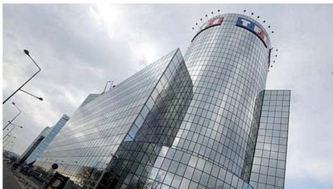
TF1 doit s'attendre à une longue traversée du désert

Selon l'étude d'un des plus grands cabinets d'analystes de médias basé à Londres, TF1 paie son retard en matière de diversification numérique et pâtit de l'atonie du marché publicitaire. Pire, la première chaîne «devra attendre deux à quatre ans pour voir le bout du tunnel».